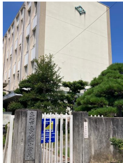
【高松市立鬼無小学校】約1,100m