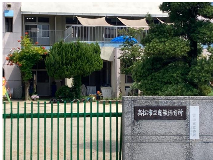
【高松市立鬼無保育園】約1,000m