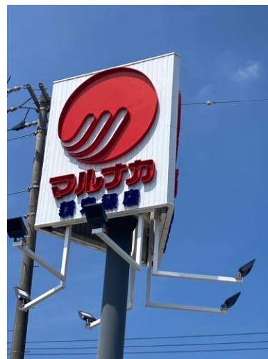
【マルナカ新鬼無店】約250m